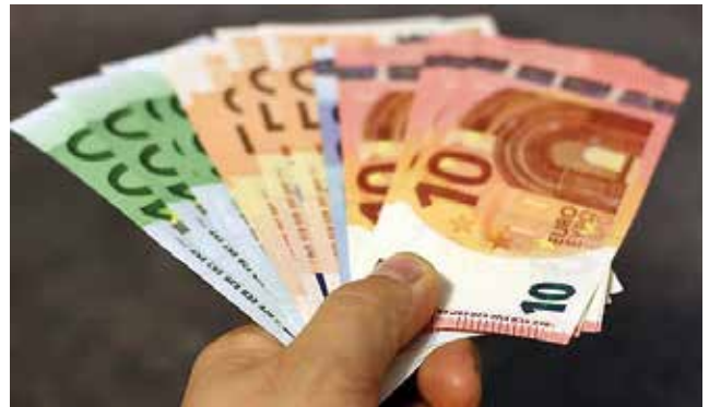
Ilustrační foto: Pixabay.