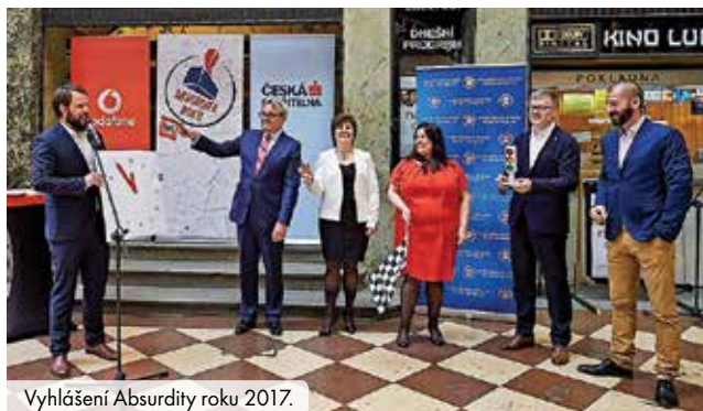
Vyhlášení Absurdity roku 2017.

Nedostaneš proplacenou fakturu? Nezájem, DPH státu zaplať! Tak by se dala shrnout absurdita, která podnikatelům už dlouho vadí. Letošní absurdita není čerstvě uzákoněnou novinkou, mnozí se s ní už naučili žít. To ale neznamená, že se s ní smířili, což ukázalo letošní hlasování o největší byrokratický nesmysl. Odvod DPH státu z nezaplacených faktur bezkonkurenčně zvítězil. Platit daň z peněz, které jsem nedostal, to se zdravému rozumu skutečně přičí.