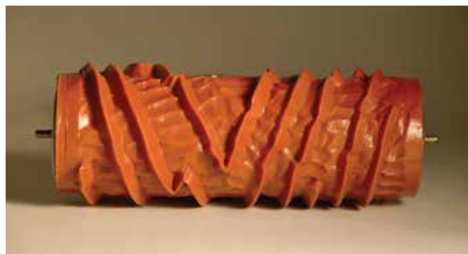
Ukázka fládrovacího nářadí: fládrovací kolíbka a válečky.