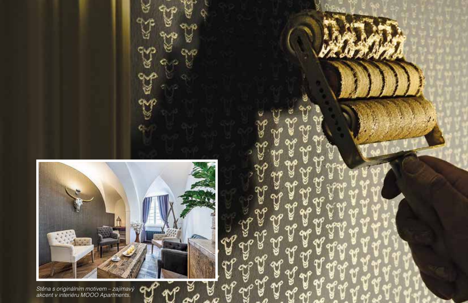
Stěna s originálním motivem – zajímavý akcent v interiéru MOOO Apartments.