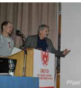
Přálo se oslavencům.