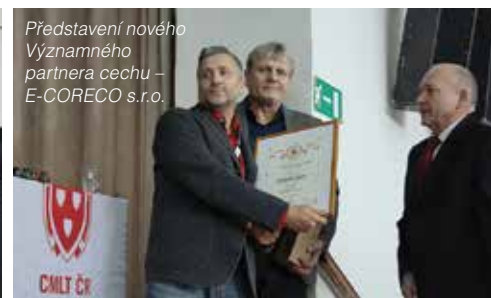
Představení nového Významného partnera cechu – E-CORECO s.r.o.