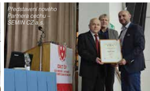
Představení nového Partnera cechu – SEMIN CZ a.s.