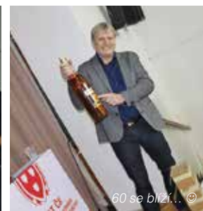
60 se blíží... ©