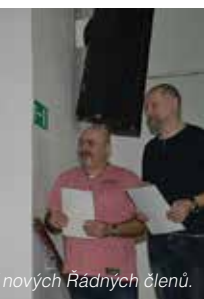
Přijetí nových Řádných členů.